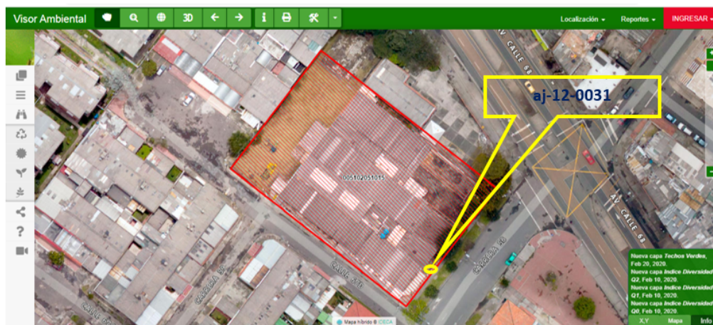
Imagen No 1. Ubicación del aljibe

Mediante la herramienta Mapa de localización de la SDA se identifica que el aljibe aj-12-0031, no se encuentra afectado por zona de manejo y preservación ambiental, corredor ecológico, ni ronda hídrica, según lo establecido en el Decreto 190 de 2004, modificado por la Resolución 228 de 2015, en la cual se precisa el límite del perímetro urbano y se dictan otras disposiciones (Imagen 1).